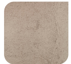
KERAMIEK 1 SAVOIA PERLA