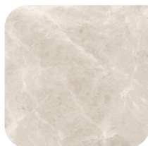
KERAMIEK 2 DIAMOND CREAM