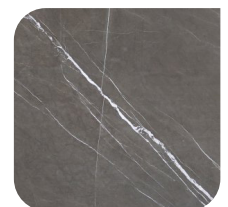
KERAMIEK 1 PIETRA GREY

De getoonde afbeeldingen dienen slechts ter indicatie. De kleur van de staal wijkt altijd iets af van de werkelijke kleur. Dit komt in de eerste plaats doordat uw beeldscherm nooit een volledig representatieve weergave van de werkelijkheid kan tonen. Daarnaast zorgt ook het gebruik van natuurlijke materialen ervoor dat er afwijkingen tussen de staal en uw tafelblad mogelijk zijn.