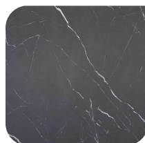
KERAMIEK 1 MARQUINIA NERO