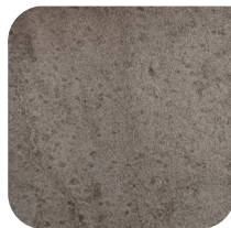
KERAMIEK 1 GRIGIO COLLO