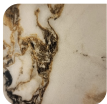
KERAMIEK 2 CARAVAGE