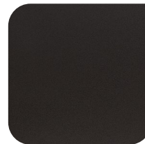
KERAMIEK 1 NERO COLLO