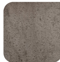
KERAMIEK 1 GRIGIO COLLO