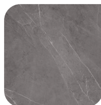
KERAMIEK 2 PIETRA GREY

De getoonde afbeeldingen dienen slechts ter indicatie. De kleur van de staal wijkt altijd iets af van de werkelijke kleur. Dit komt in de eerste plaats doordat uw beeldscherm nooit een volledig representatieve weergave van de werkelijkheid kan tonen. Daarnaast zorgt ook het gebruik van natuurlijke materialen ervoor dat er afwijkingen tussen de staal en uw tafelblad mogelijk zijn.