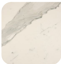
KERAMIEK 1 BIANCO SALUTO