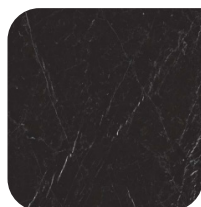
KERAMIEK 2 MARQUINIA NERO