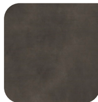
KERAMIEK 1 CALCE NERO