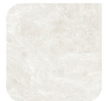
KERAMIEK 2 DIAMOND CREAM