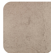
KERAMIEK 1 SAVOIA PERLA